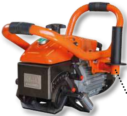
Manija adicional posicionable