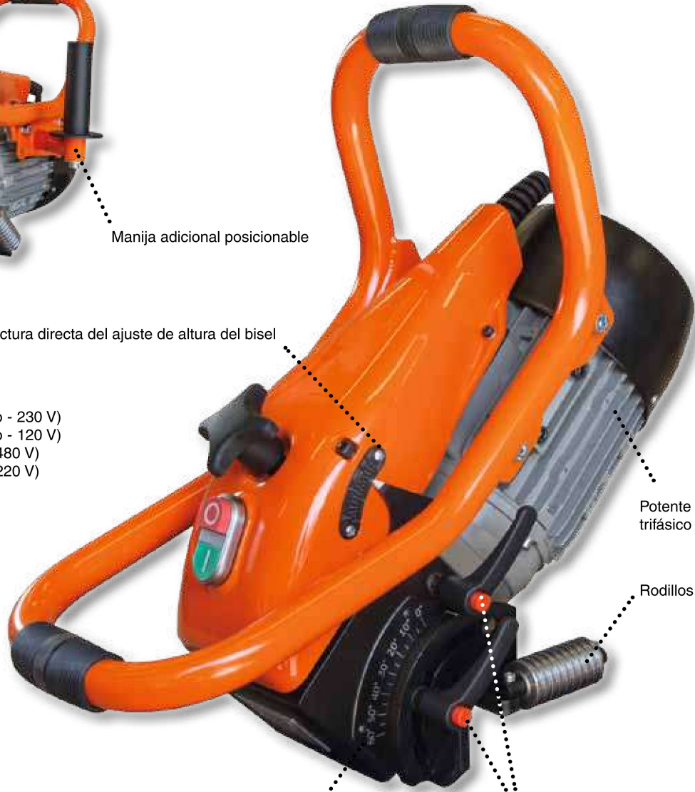
Potente motor trifásico de 1100W