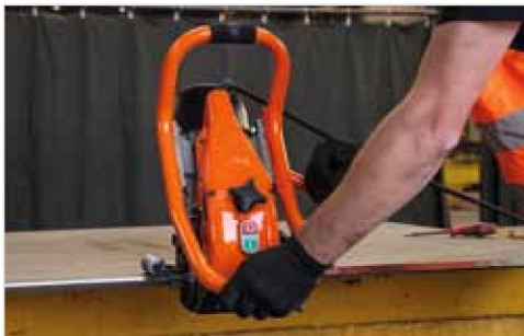
Escala de precisión para el ajuste de ángulo de bisel